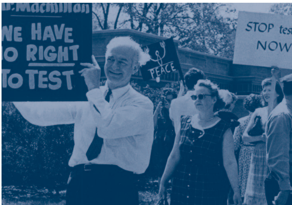
Linus Pauling protesta contra la prueba de armas nucleares frente a la Casa Blanca, abril 1962

El juez Christopher Weeramantry, presidente de la Asociación Internacional de Abogados contra las Armas Nucleares, fue uno de los magistrados que participaron en el caso. Él presentó una opinión personal aparte, en la que manifestó que “el uso o la amenaza de uso de armas