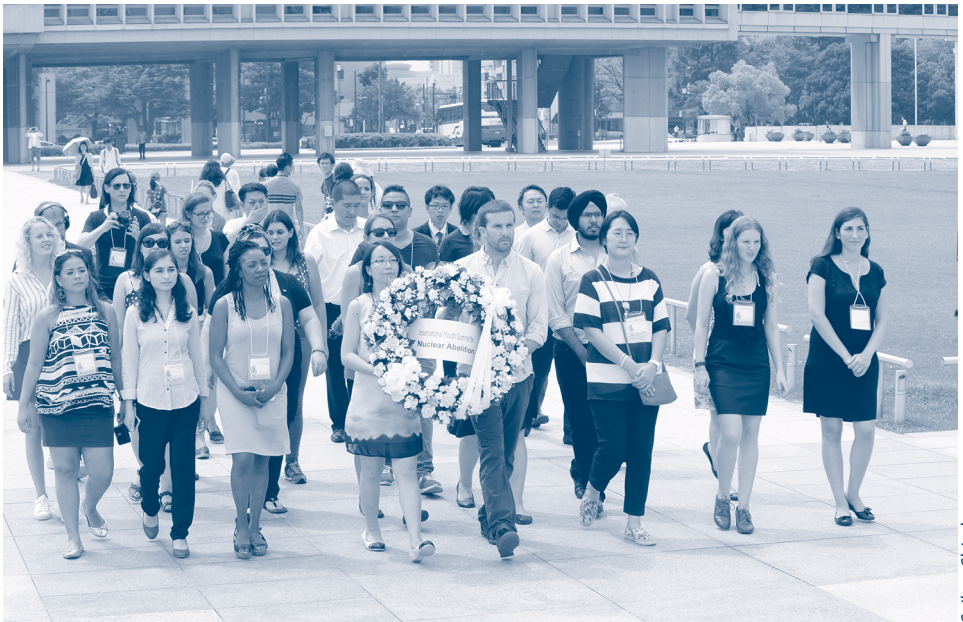
Delegados de la Cumbre Internacional de Jóvenes para la Abolición Nuclear, en Hiroshima, Japón, en agosto de 2015

Organizada por seis grupos, entre los cuales está la SGI, dicha cumbre contó con la participación de jóvenes de