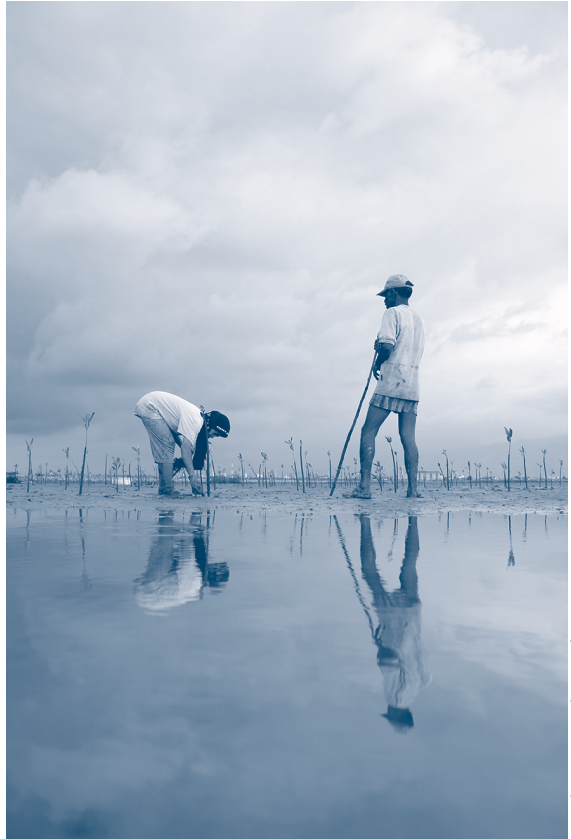
Replantando pimpollos de manglar en Banda Aceh, Indonesia, en febrero de 2012

la esperanza: Pasos hacia el cambio, perspectivas de sostenibilidad». Con los años, una gran cantidad de estudiantes de enseñanza primaria y secundaria han recorrido estas muestras, que han demostrado ser una herramienta eficaz para la educación ambiental.