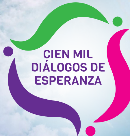
Imagen: Mat Beating